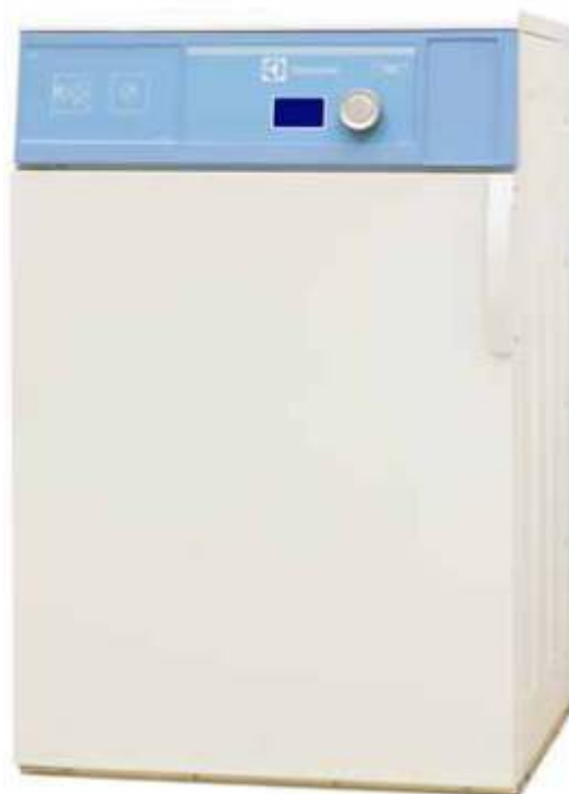
Esitetyt kuvat ovat vain tuotteen esittelyä varten ja erilaisuuksia saattaa olla todelliseen malliin.